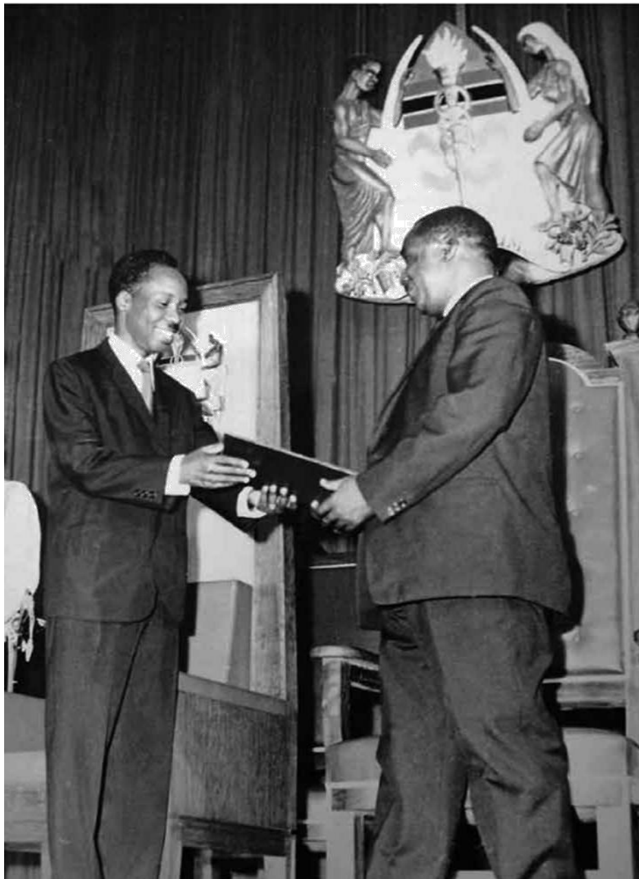
Mwalimu Julius Kambarage Nyerere (kushoto) na Sheikh Abeid Amani Karume wakibadilishana Hati za Muungano wa Tanganyika na Zanzibar tarehe 27 Aprili, 1964.